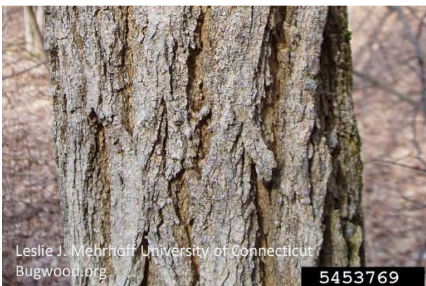
Tief gefurchte, graubraune Rinde