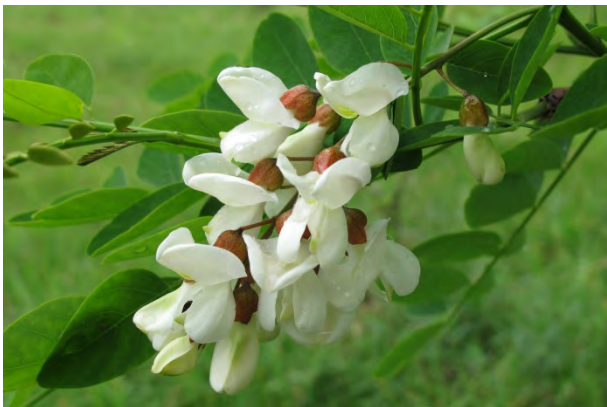
Blüten in hängenden, weißen Trauben