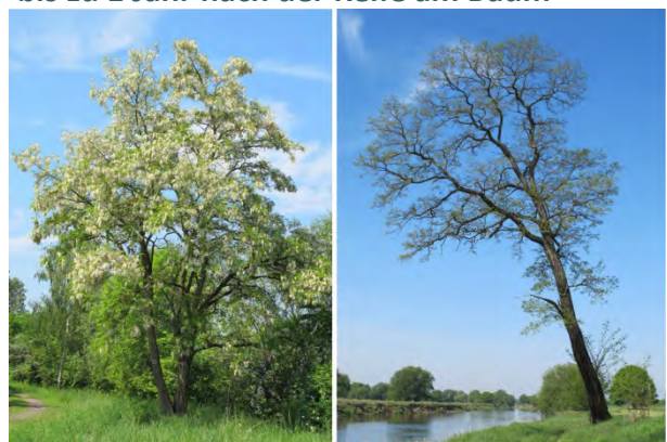
Baum im blühendem und nicht blühendem Zustand

Die Robinie wird bis zu 38m hoch. Die Triebe besitzen Dornen. Der ganze Baum, besonders die Rinde und die Früchte, sind für Menschen und Tiere giftig.