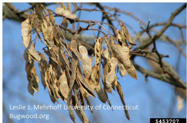
5-10cm lange Hülsen mit 4-10 Samen, bleiben bis zu 1 Jahr nach der Reife am Baum