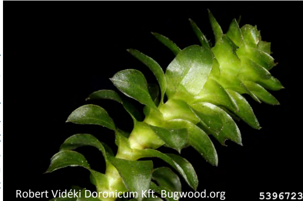
Robert Vidéki Doronicum Kft. Bugwood.org 5396723

Blätter dunkelgrün, klein, 1-3 cm lang, breiter als 2 mm, (2-5mal so lang wie breit), vorn abgerundet