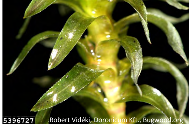
5396727 Robert Vidéki, Doronicum Kft., Bugwood.org

Blätter dunkelgrün, klein, 1-3 cm lang, breiter als 2 mm, (2-5mal so lang wie breit), vorn abgerundet