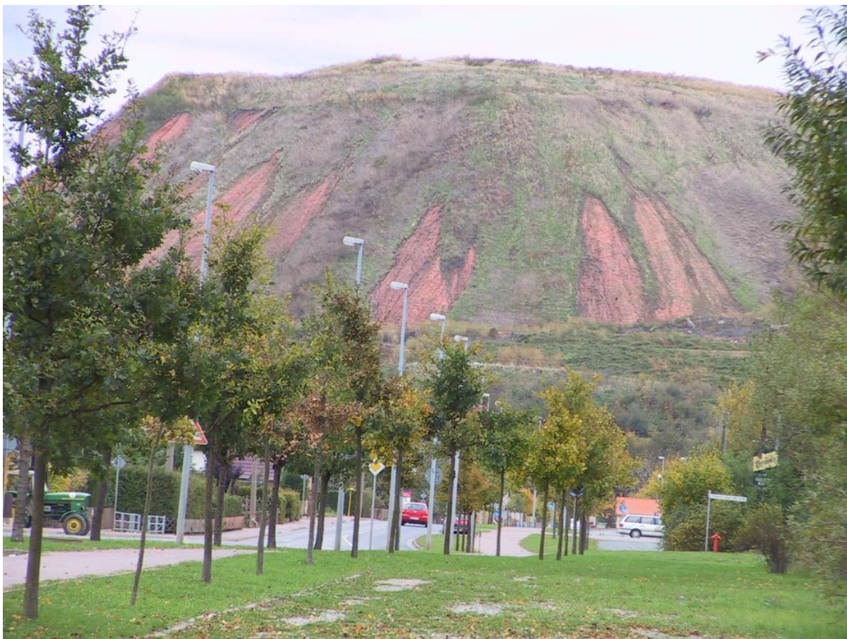
Abb. 5: Kalirückstandshalde Bleicherode (Landkreis Nordhausen) mit aufgebrauchten Abdeckungsschichten

Eigenkontrolle nach der Thüringer Kalihaldenrichtlinie; parallel führt die TLUG entsprechende Analysen als Behördenkontrolle durch. Alle diese Daten werden in der zentralen Datenbank der TLUG gespeichert und ausgewertet. Aktuell werden im Sondermessnetz Kalihalden Südharz insgesamt 47 Messstellen beprobt (8 Haldensickerwassermessstellen, 6 Oberflächenwassermessstellen, 2 Quellen, 25 Grundwasserbeobachtungsrohre und 6 Niederschlagsmessstationen).