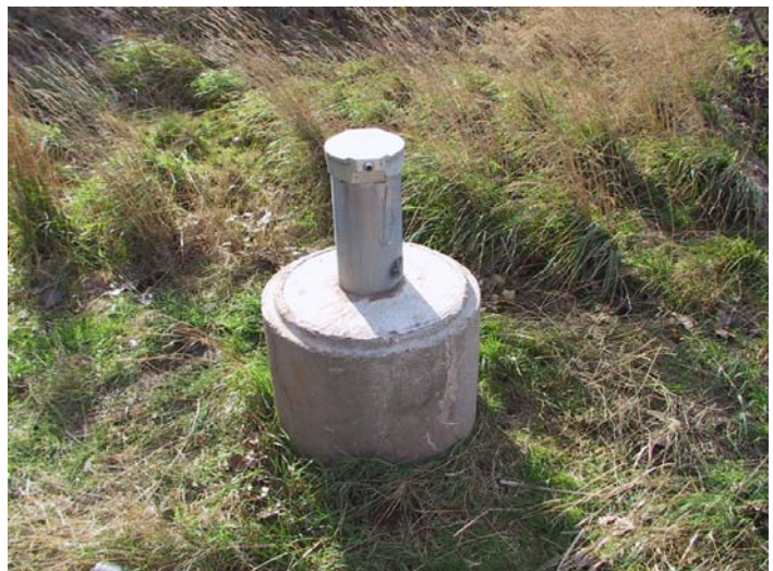
Abb. 1: Grundwasserbeobachtungsrohr Windehausen (Landkreis Nordhausen)

Das Territorium des Freistaates Thüringen ist nach Vorgaben der Europäischen Wasserrahmenrichtlinie (EG-WRRL) gemäß hydrogeologischen Gesichtspunkten in 75 Grundwasserkörper eingeteilt, von denen sich auch einige bis in die benachbarten Bundesländer ausdehnen.