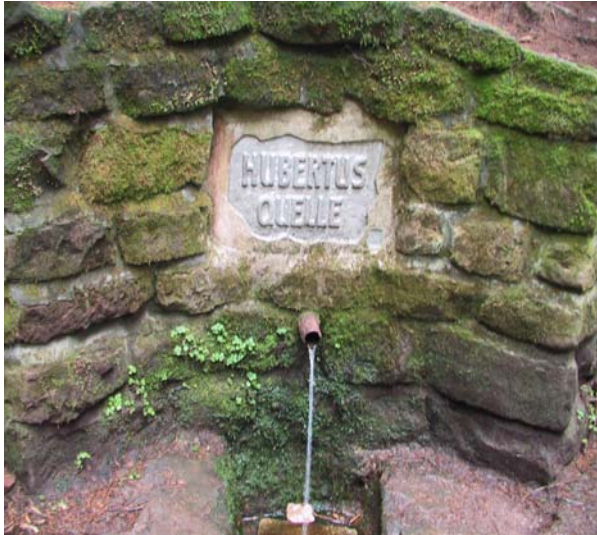
Abb. 2: Hubertusquelle bei Bobeck (Saale-Holzland-Kreis)